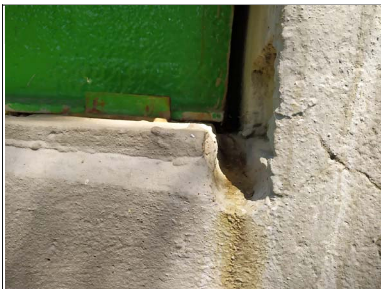
Pohled na dilataci