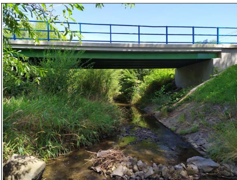
Prostorové uspořádání pod mostem (protivodní)