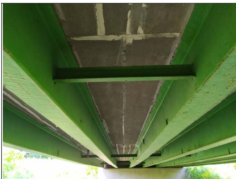
Podhled nosné konstrukce - s pohledem k opěře 1