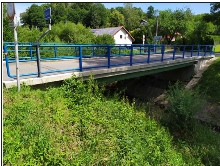
Boční pohled k opěře 2 (pravý)