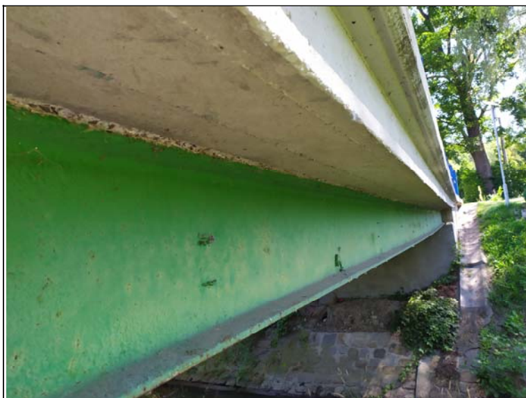
Podhled nosné konstrukce - s pohledem k opěře 2, pravý nosník