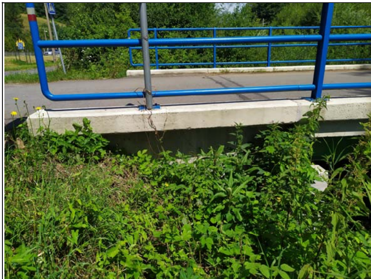
Pohled na pravé křídlo opěry 1