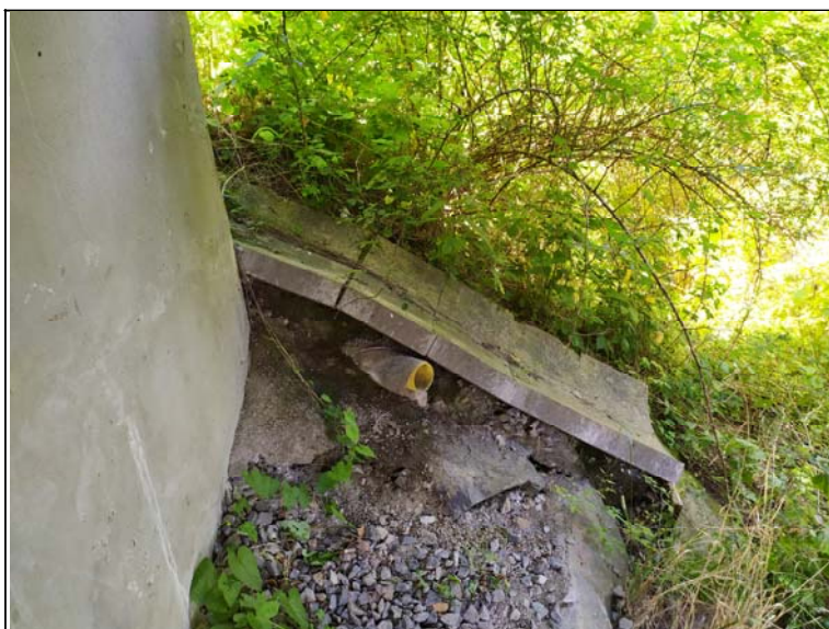
Skluz u opěry 1 vlevo