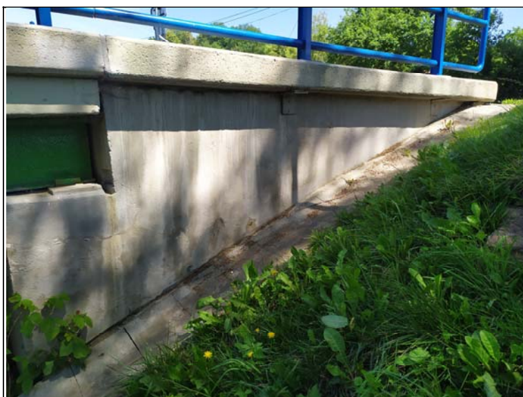
Pohled na pravé křídlo opěry 2