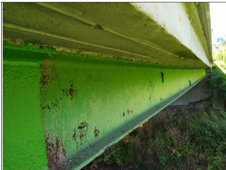
Podhled nosné konstrukce - s pohledem k opěře 1, levý nosník