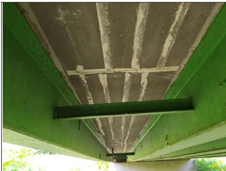
Podhled nosné konstrukce - s pohledem k opěře 1