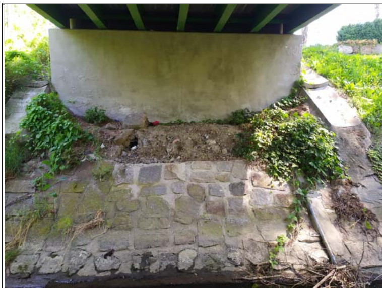
Pohled na opěru 2