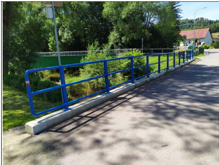
Pravé zábradlí - s pohledem k opěře 1