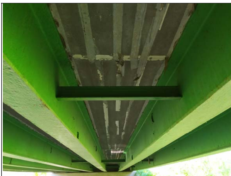
Podhled nosné konstrukce - s pohledem k opěře 1