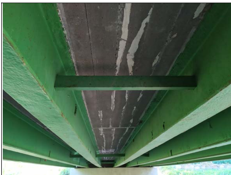
Podhled nosné konstrukce - s pohledem k opěře 2