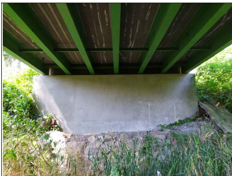
Pohled na opěru 1