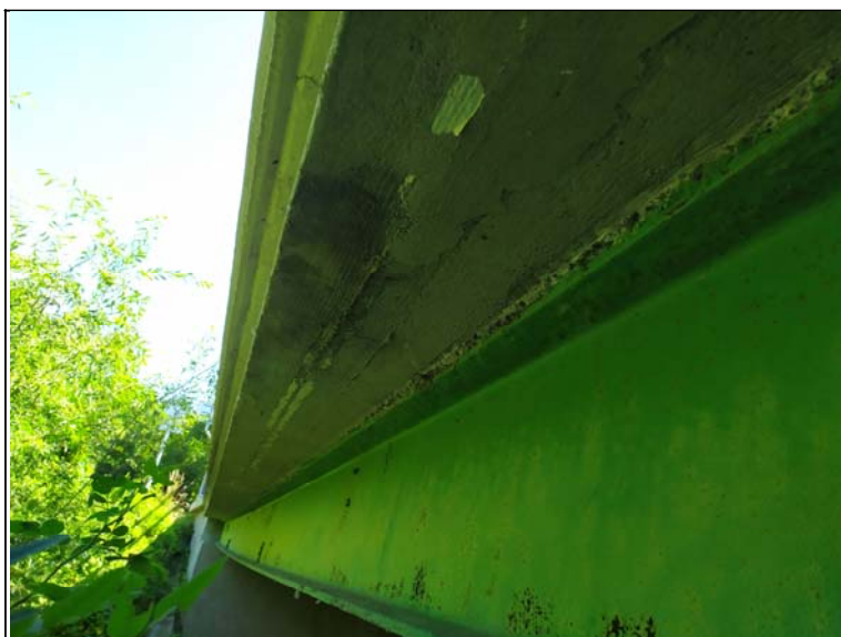
Podhled nosné konstrukce - s pohledem k opěře 2, levý nosník