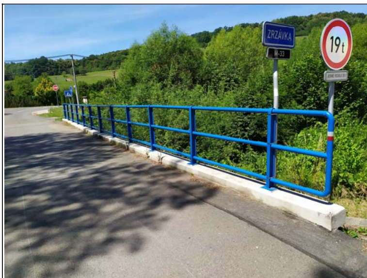
Levé zábradlí - s pohledem k opěře 1