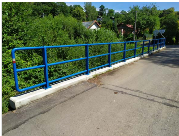
Levé zábradlí - s pohledem k opěře 2