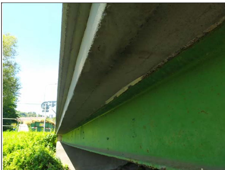
Podhled nosné konstrukce - s pohledem k opěře 1, pravý nosník