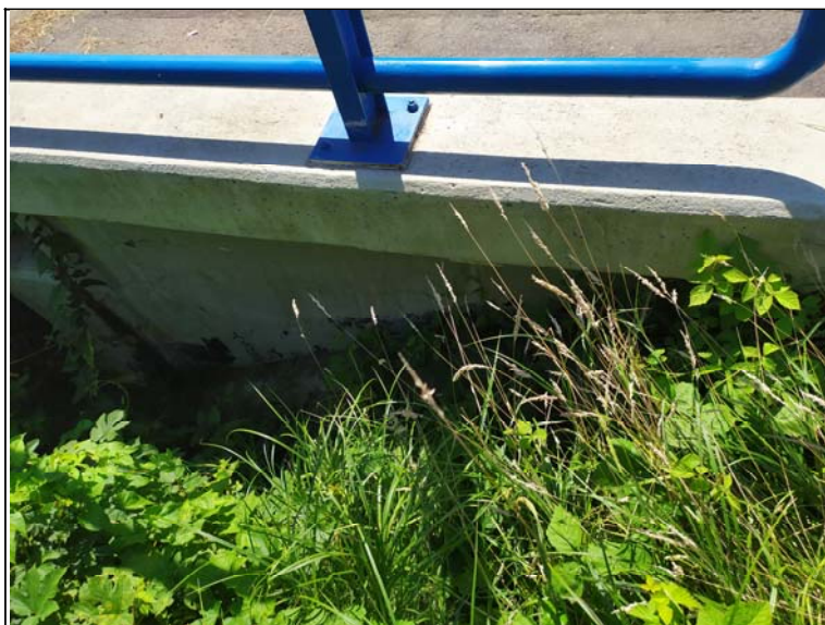
Pohled na levé křídlo opěry 1