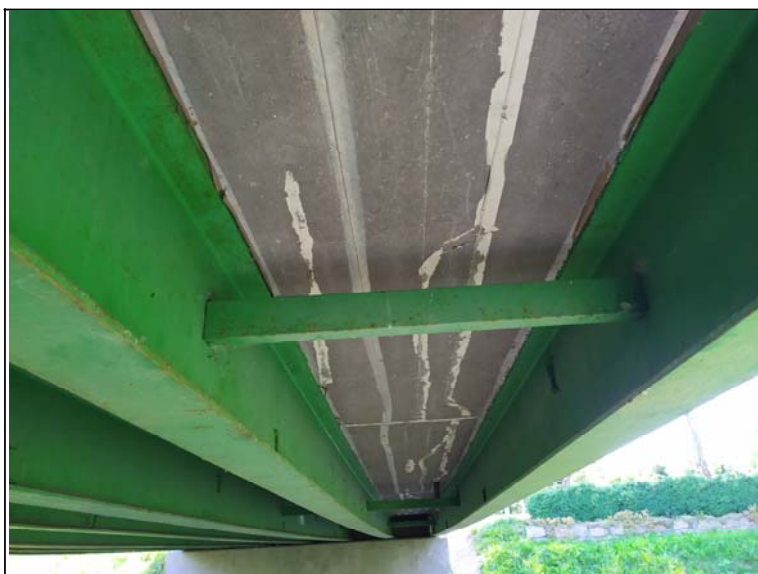
Podhled nosné konstrukce - s pohledem k opěře 2