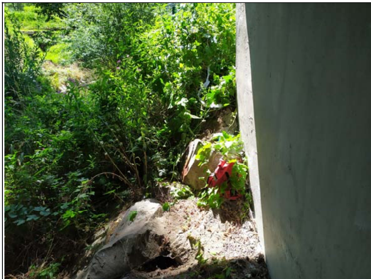
Skluz u opěry 1 vpravo