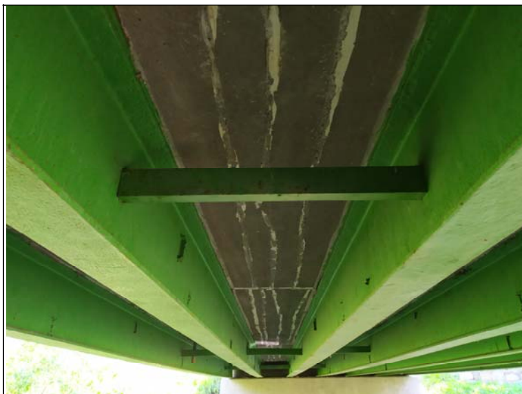
Podhled nosné konstrukce - s pohledem k opěře 2