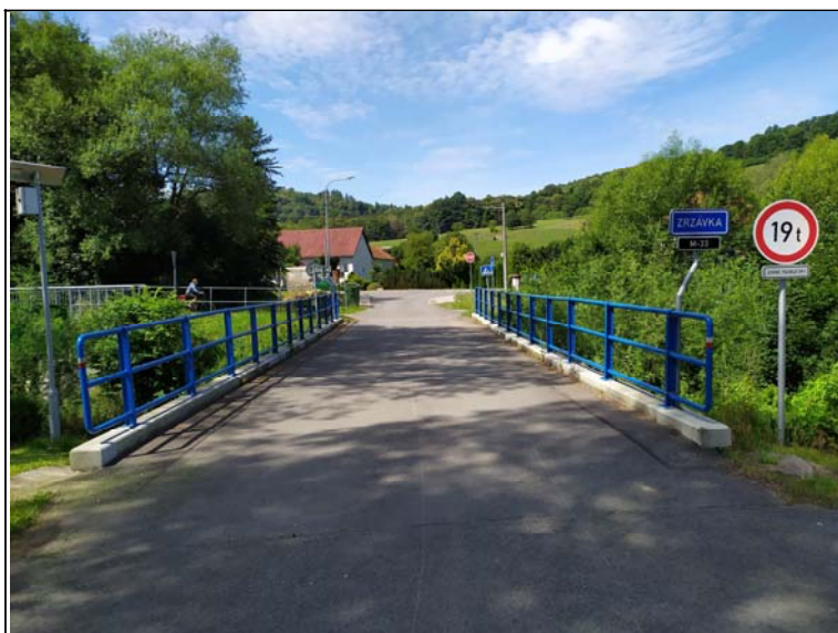
Prostorové uspořádání na mostě (proti směru staničení)