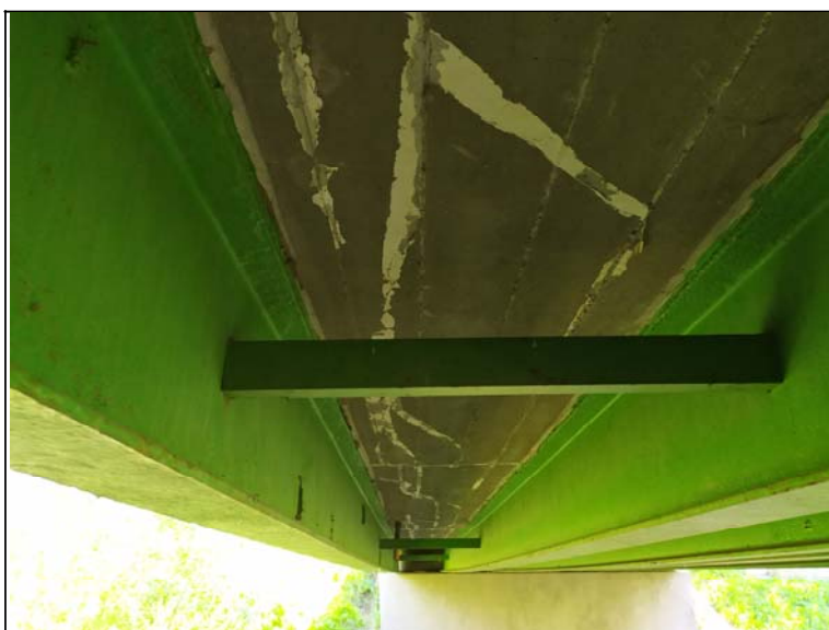
Podhled nosné konstrukce - s pohledem k opěře 2