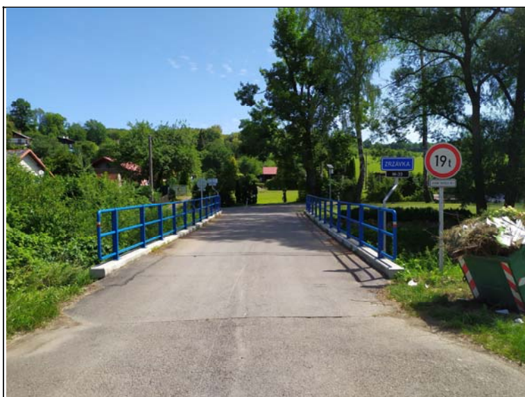
Prostorové uspořádání na mostě (ve směru staničení)