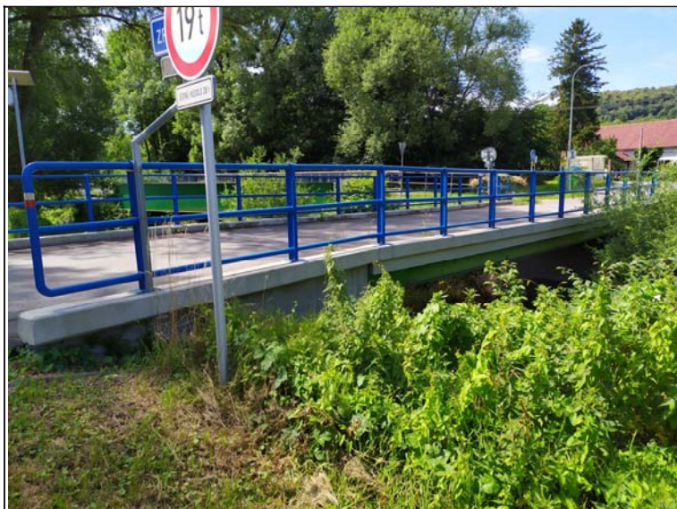
Boční pohled k opěře 1 (levý)