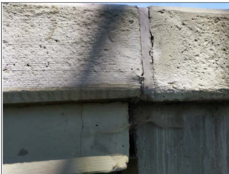
Pohled na dilataci