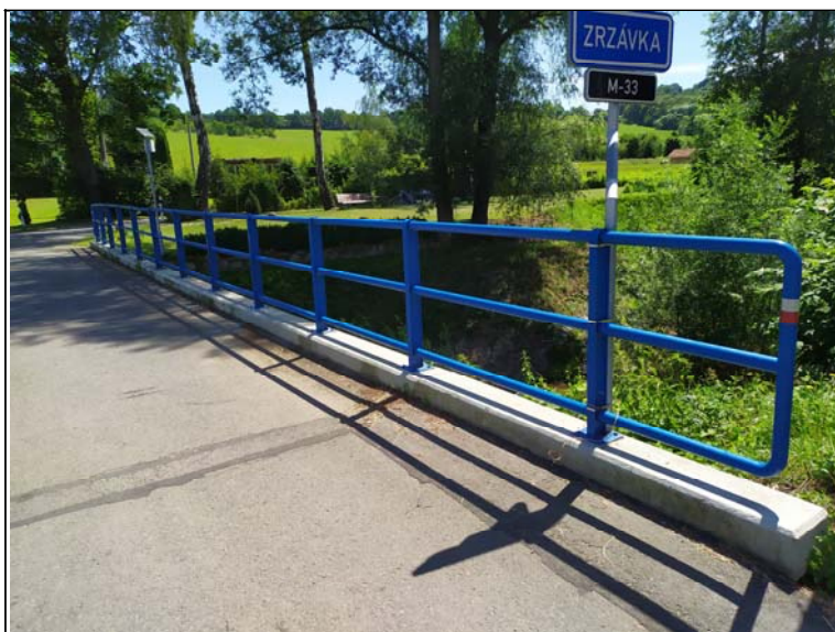
Pravé zábradlí - s pohledem k opěře 2