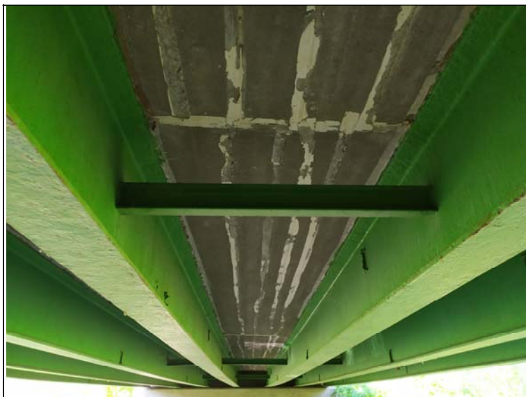
Podhled nosné konstrukce - s pohledem k opěře 1