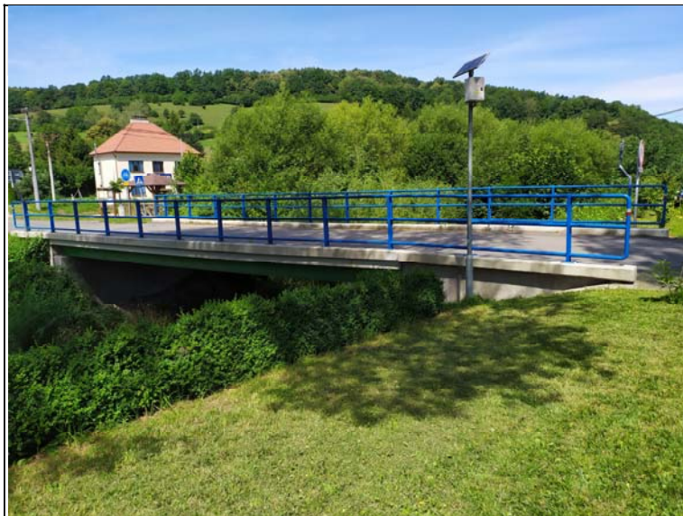
Boční pohled k opěře 1 (pravý)