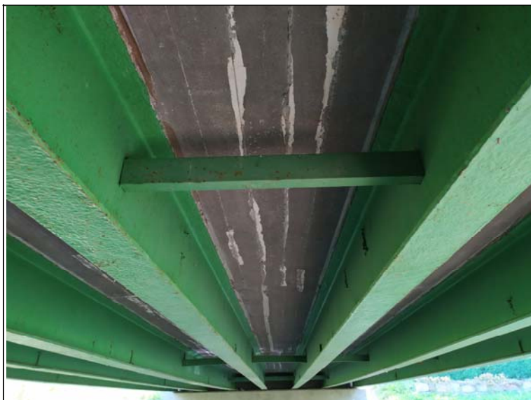
Podhled nosné konstrukce - s pohledem k opěře 2