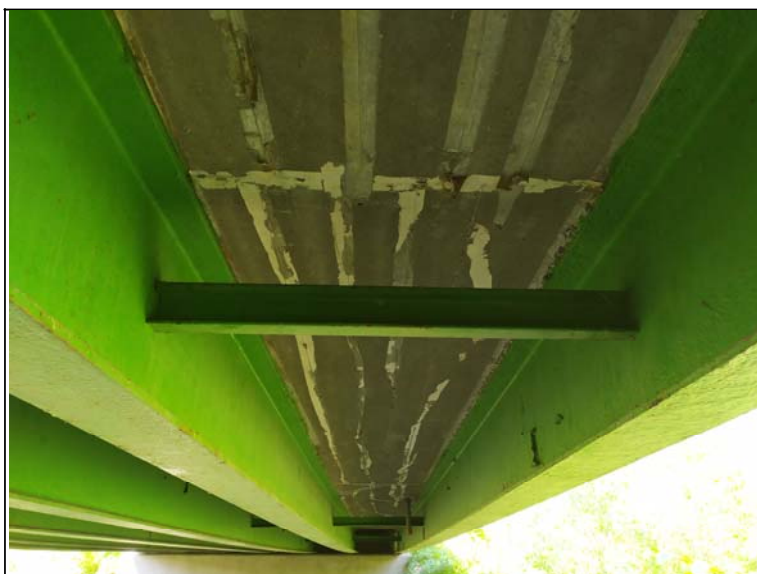
Podhled nosné konstrukce - s pohledem k opěře 1