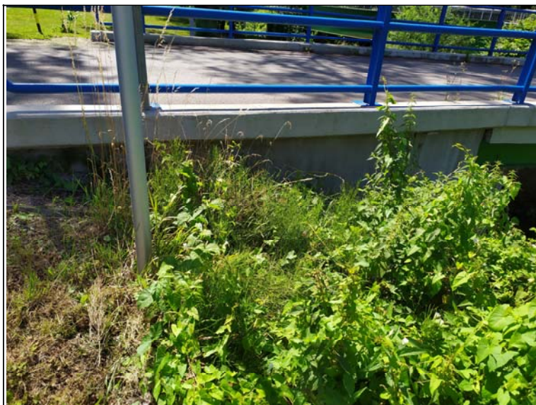
Pohled na levé křídlo opěry 2