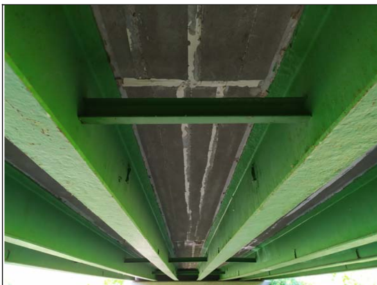
Podhled nosné konstrukce - s pohledem k opěře 1